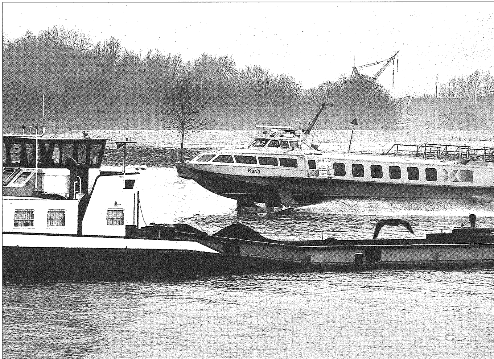
Een draagvleugelboot tussen Rotterdam en Dordrecht. De reistijd voor forensen is daar verkort van 60 naar 25 minuten.